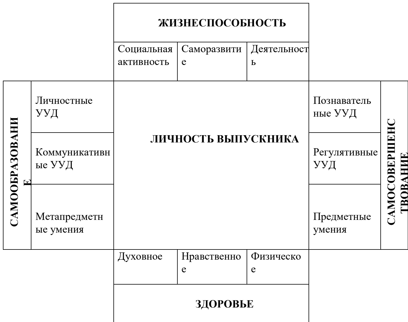
Рис. 1. Модель выпускника СДЮТурЭ